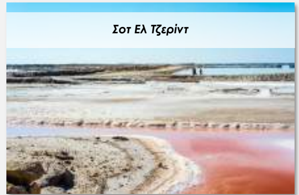
Σοτ ΕΛ Τζερίντ

Το τελικό ενημερωτικό αποστέλλεται περίπου 3-5 ημέρες πριν από την εκάστοτε αναχώρηση.