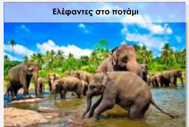
Ελέφαντες στο ποτάμι