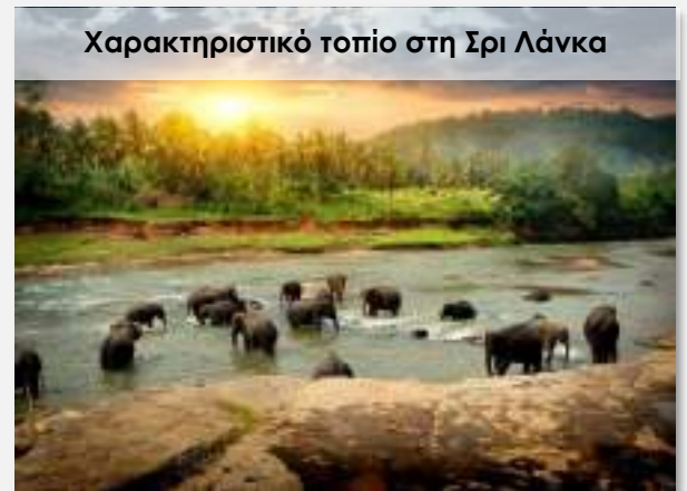
Χαρακτηριστικό τοπίο στη Σρι Λάνκα