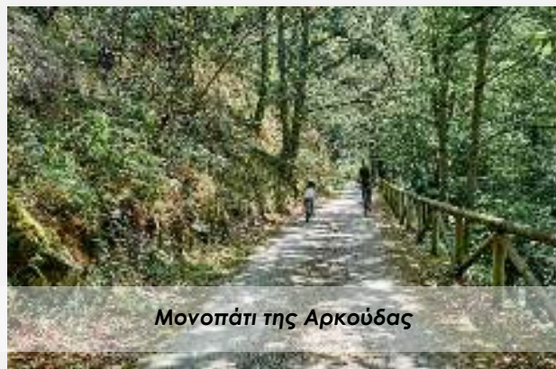
Μονοπάτι της Αρκούδας

Πρωινό στο ξενοδοχείο και ξεκινάμε τη βόλτα μας στο Σαντιάγο . Θα δούμε την κεντρική Πλατεία Ομπραδόιρο με το αναγεννησιακό ανάκτορο Ραχόι, του 1766, στο οποίο σήμερα κατοικεί ο Πρόεδρος της Γαλικίας. Στην ίδια πλατεία βρίσκεται και ο καθεδρικός Σαντιάγο ντε Κομποστέλα (9ος αι.), από τους ελάχιστους ναούς παγκοσμίως που είναι χτισμένοι πάνω σε τάφο Αγίου. Θα δούμε επίσης τον ναό Σάντα Μαρία ντο Σαρ του 12ου αιώνα. Το μπαρόκ Αβαείο Σαν Μαρτίν Πινάριο του 16ου αιώνα. Στη βόλτα μας, θα περάσουμε και από το Πανεπιστήμιο, το οποίο άρχισε να λειτουργεί το 1504. Έφτασε η ώρα να επιβιβαστούμε στο πούλμαν για μία εκδρομή στο Ακρωτήριο Φινιστέρε που