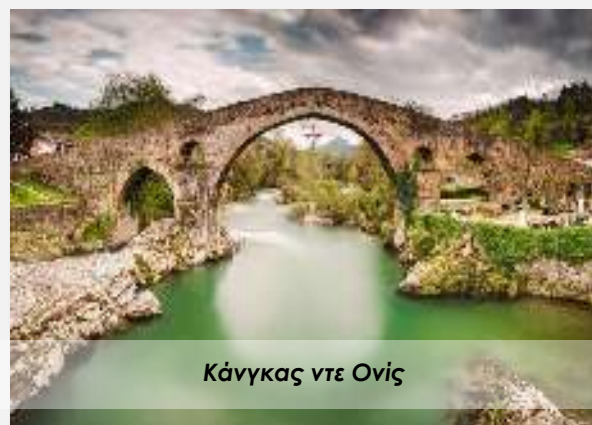
Κάνγκας ντε Ονίς