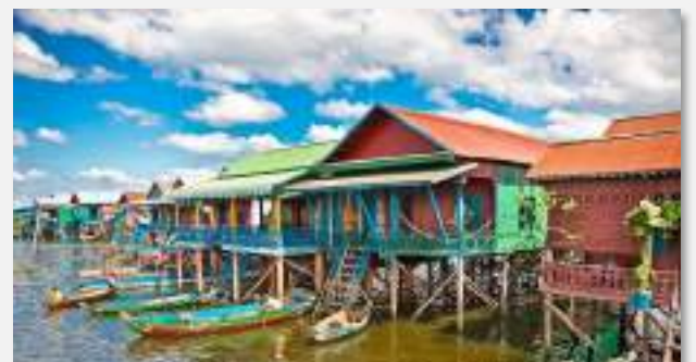
Λίμνη Τόνλε Σαπ