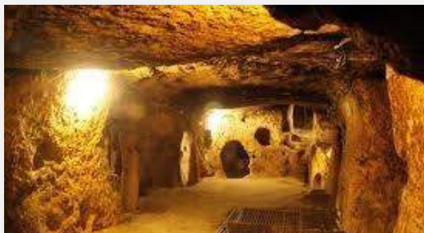
Τούνελ Κου Τσι