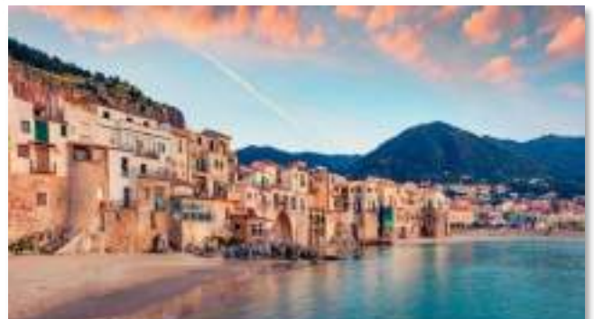
Το γραφικό λιμανάκι της Κεφαλούς στη βόρεια Σικελία. Στην πόλη υπάρχει έντονο το ελληνικό και βυζαντινό στοιχείο.