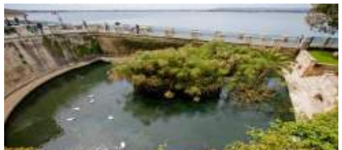
Το σιντριβάνι Αρετούσα όπου φυτρώνει και αναπτύσσεται το φυτό πάπυρος