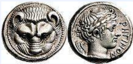
Τετράδραχμο του Ρήγιου, 415-387 π.Χ.

Το Ρήγιο ήταν μία από τις αρχαιότερες ελληνικές αποικία της Μεγάλης Ελλάδας. Ιδρύθηκε το 720 π.Χ. από Ευβοείς και αρχικά ονομαζόταν Ερυθρά. Η πόλη βρισκόταν σε ιδιαίτερα προνομιακή θέση, καθώς ήταν χτισμένη σχεδόν στο νοτιότερο σημείο της Ιταλικής χερσονήσου, στον πορθμό της Μεσσήνης.