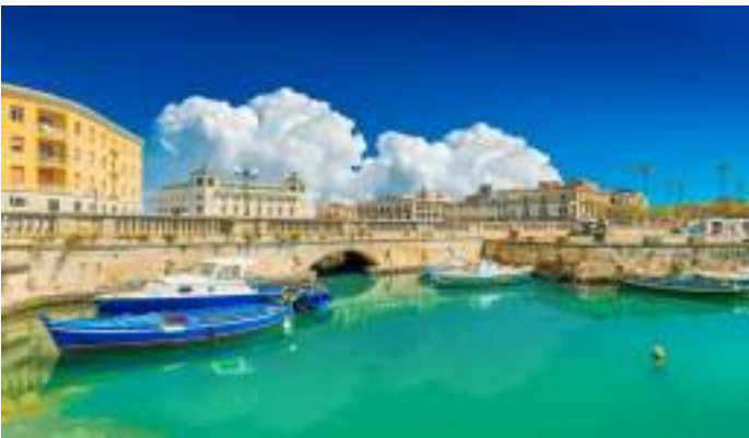
Αποψη της Ορτυγίας από το λιμάνι

Η Ορτυγία είναι ένα μικρό νησί μπροστά ακριβώς από τις σύγχρονες Συρακούσες. Αποτελεί το ιστορικό κέντρο της πόλης, τις αρχαίες Συρακούσες δηλαδή, και χτίστηκε από τους Κορίνθιους το 735 π.Χ. Ονομάζεται από τους ντόπιους και Παλαιά Πόλη. Συνδέεται με τις Συρακούσες με τη γέφυρα Ουμπερτίνο η οποία βρίσκεται ανάμεσα στο Παλαιό και στο Νέο Λιμάνι τους.