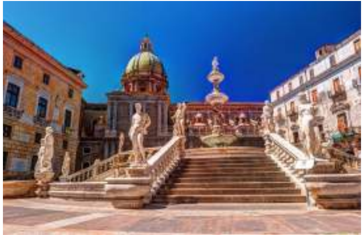
Το διάσημο «Σιντριβάνι της Ντροπής» στο Παλέρμο, στην μπαρόκ πλατεία Πρετορία. Την ονομασία του πήρε εξαιτίας των γυμνών αγαλμάτων που το περιστοιχίζουν.