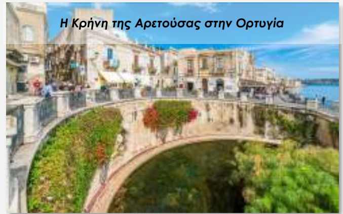
Η Κρήνη της Αρετούσας στην Ορτυγία

Τακτοποίηση στο ξενοδοχείο στον Ακράγαντα και διανυκτέρευση.