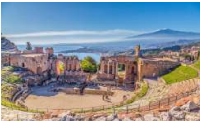
Αρχαίο ελληνικό θέατρο στην Ταορμίνα της Σικελίας. Στο βάθος φαίνεται καπνός από το ηφαιστειο της Αίτνας.