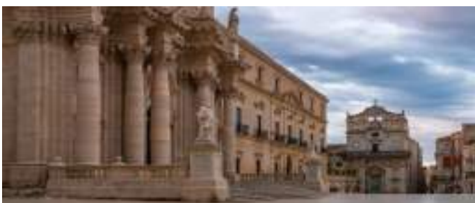
Η πανέμορφη μαρμάρινη κεντρική πλατεία της Ορτυγίας

Οι αρχαίες Συρακούσες απέκτησαν με τα χρόνια πολύ μεγάλη δύναμη και... μπήκαν στο μάτι των Αθηνών. Έτσι το 415 π.Χ. προκλήθηκε η Σικελική Εκστρατεία με ολέθρια αποτελέσματα για τους Αθηναίους. Περί τους 7.000 αιχμαλώτους φυλακίστηκαν από τους Συρακούσιους στα λατομεία δίπλα στο ελληνιστικό θέατρο και αφέθηκαν να πεθάνουν από αστία και κακουχίες. Όσοι γλύτωσαν πωλήθηκαν ως δούλοι. Αυτό το ζοφερό στρατόπεδο συγχρωσης διατηρείται ως σήμερα και αποτελεί μέρος του αρχαιολογικού χώρου. Στις δε πινακίδες αναγράφεται ως «Λατομείο εν Παραδείσω»!