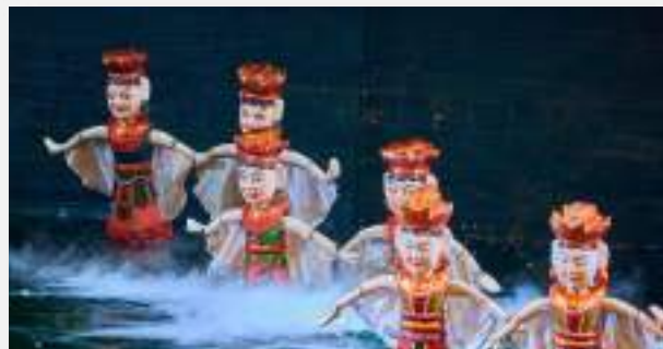
μαριονέτες στο νερό

Πρωινή ξενάγηση της πόλης, κατά τη διάρκεια της οποίας θα θαυμάσουμε, μεταξύ άλλων, τα υπέροχα γαλλικά αποικιακά κτίρια του κέντρου, θα επισκεφθούμε το επιβλητικό μασωλείο του Χο Τσι Μινχ, τόπο αμέριστου σεβασμού για τους Βιετναμέζους, την πλατεία Μπα Ντιν καθώς και τη διάσημη Μονόστηλη Βουδιστική Παγόδα. Στη συνέχεια αναχωρούμε προς τον νότο, τα απέραντα αγροτικά τοπία της περιφέρειας του Ανόι, και το Νιν Μπιν. Θα επισκεφτούμε την τοποθεσία της πρώτης πρωτεύουσας του Βιετνάμ, της Χόα Λου (10ος-11ος αι.), που βρίσκεται στην άκρη του Δέλτα του Κόκκινου ποταμού.