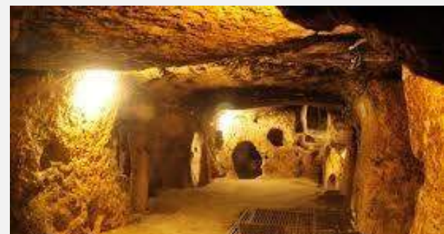
Τούνελ Κου Τσι