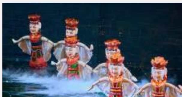
μαριονέτες στο νερό

Πρωινή ξενάγηση της πόλης, κατά τη διάρκεια της οποίας θα θαυμάσουμε, μεταξύ άλλων, τα υπέροχα γαλλικά αποικιακά κτίρια του κέντρου, θα επισκεφθούμε το επιβλητικό μασωλείο του Χο Τσι Μινχ, τόπο αμέριστου σεβασμού για τους Βιετναμέζους, την πλατεία Μπα Ντιν καθώς και τη διάσημη Μονόστηλη Βουδιστική Παγόδα. Στη συνέχεια αναχωρούμε προς τον νότο, τα απέραντα αγροτικά τοπία της περιφέρειας του Ανόι, και το Νιν Μπιν. Θα επισκεφτούμε την τοποθεσία της πρώτης πρωτεύουσας του Βιετνάμ, της Χόα Λου (10ος-11ος αι.), που βρίσκεται στην άκρη του Δέλτα του Κόκκινου ποταμού.