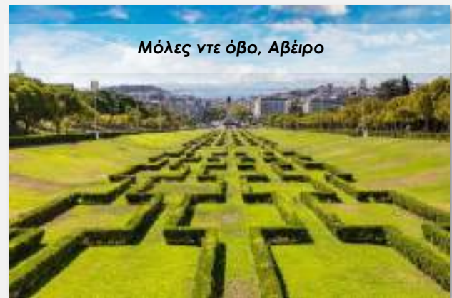
Μόλες ντε όβο, Αβέιρο