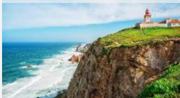
Κάμπο ντα Ρόκα

Το τελικό ενημερωτικό αποστέλλεται περίπου 3-5 ημέρες πριν από την εκάστοτε αναχώρηση.