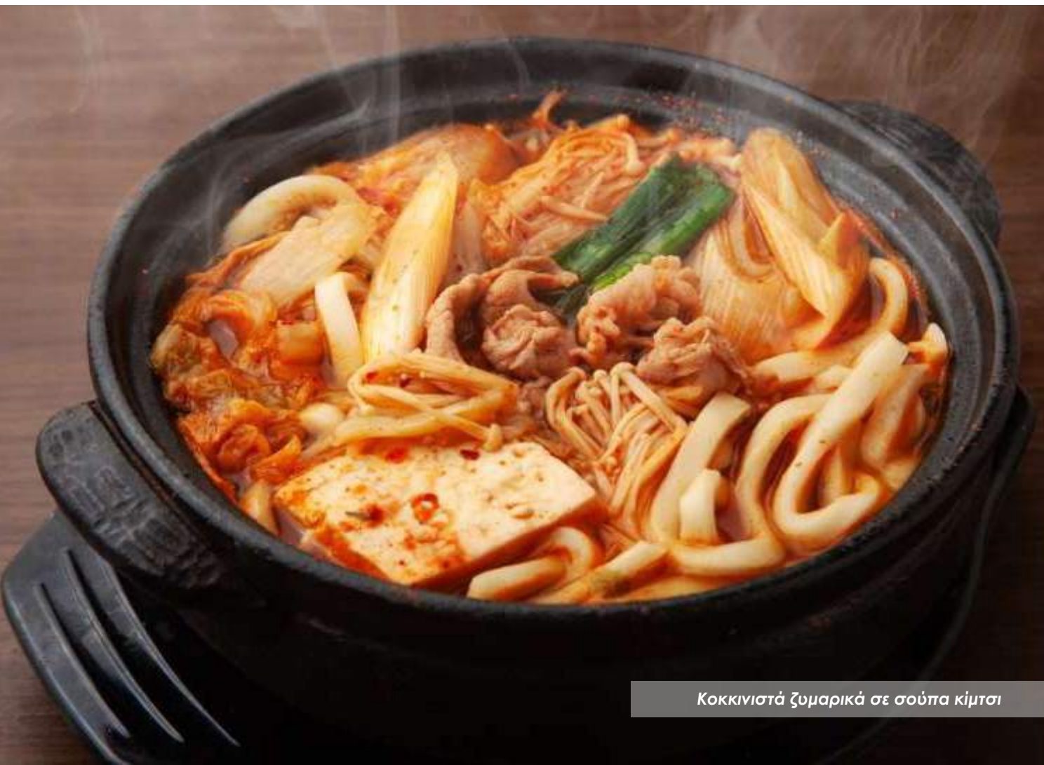
Κοκκινιστά ζυμαρικά σε σούπα κίμτσι