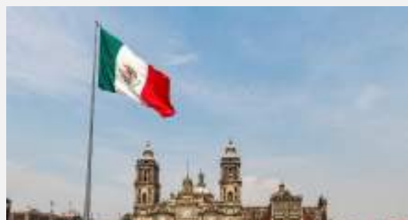
Πόλη του Μεξικού