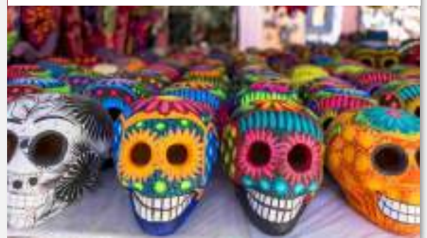
Ημέρα των Νεκρών