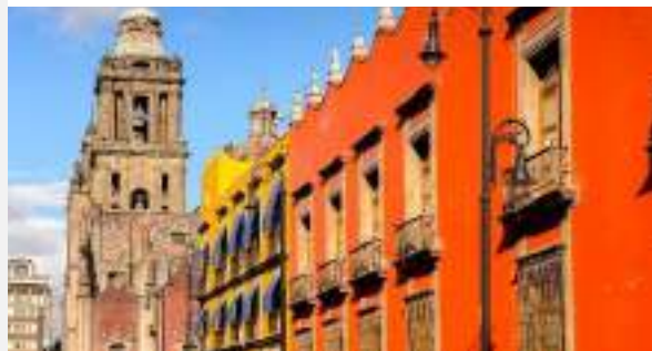
Πόλη του Μεξικού

Το παραπάνω πρόγραμμα είναι ενδεικτικό. Το τελικό ενημερωτικό αποστέλλεται περίπου 3-5 ημέρες πριν από την εκάστοτε αναχώρηση.