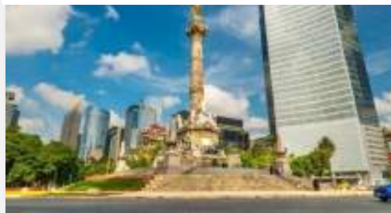
Πόλη του Μεξικού

Την πλατεία περιβάλλουν μοναδικά μνημεία, χαρακτηριστικά κτίσματα των πολιτισμών που σημάδευσαν την ιστορία του τόπου. Θα επισκεφτούμε τον εντυπωσιακό Καθεδρικό Ναό, έξοχο δείγμα αποικιακής αρχιτεκτονικής γνωστής ως churrigueresque και θα δούμε (εξωτερικά) το Προεδρικό Μέγαρο (Παλάσιο Νασιονάλ), που κρύβει στην εσωτερική του αυλή αριστουργήματα του μεγαλύτερου εκπροσώπου της μεξικάνικης τοιχογραφίας, του Ντιέγκο Ριβέρα (συντρόφου της Φρίντα Κάλο). Εικονογραφημένα