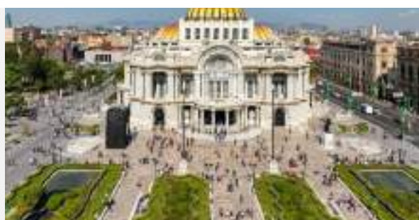
Πόλη του Μεξικού