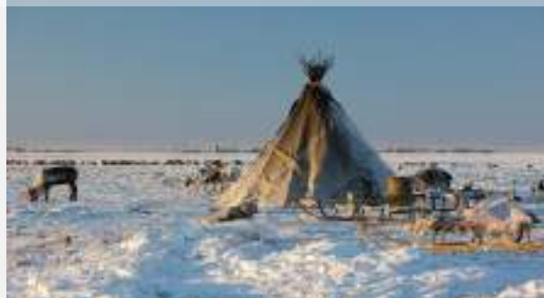
Παραδοσιακή σκηνή λάβου των Σάμι