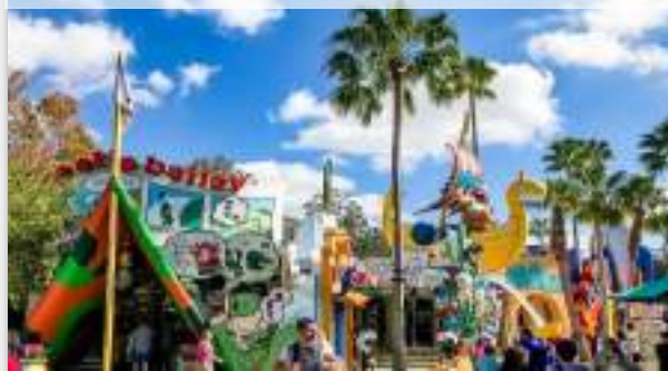
Ορλάντο - Disneyworld

Άλλη μία ημέρα χαλάρωσης και απόλαυσης μας περιμένει, με φόντο τα νερά της Καραϊβικής. Φτάνουμε στο Γκρέϊτ Στίρουπ Κέι , στο μικρό νησάκι που ανήκει στις Νήσους Μπέρι στις Μπαχάμες. Εμείς θα απολαύσουμε τα μαγευτικά, τρκουάζ νερά και τη χρυσή αμμουδιά της παραλίας που βρίσκεται στο βόρειο τμήμα του νησιού. Θα θαυμάσουμε τον πλούσιο βυθό και τα πολύχρωμα ψάρια που ζουν εδώ και θα χαλαρώσουμε κάτω από τον... ήλιο του Δεκέμβρη στις Μπαχάμες, πριν επιστρέψουμε στο κρουαζιερόπλοιο για την αναχώρησή μας με προορισμό το Μαϊάμι. Διανυκτέρευση εν πλω.