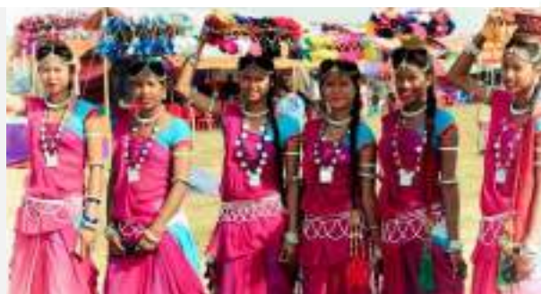
κοπέλες της φυλής Τάρου