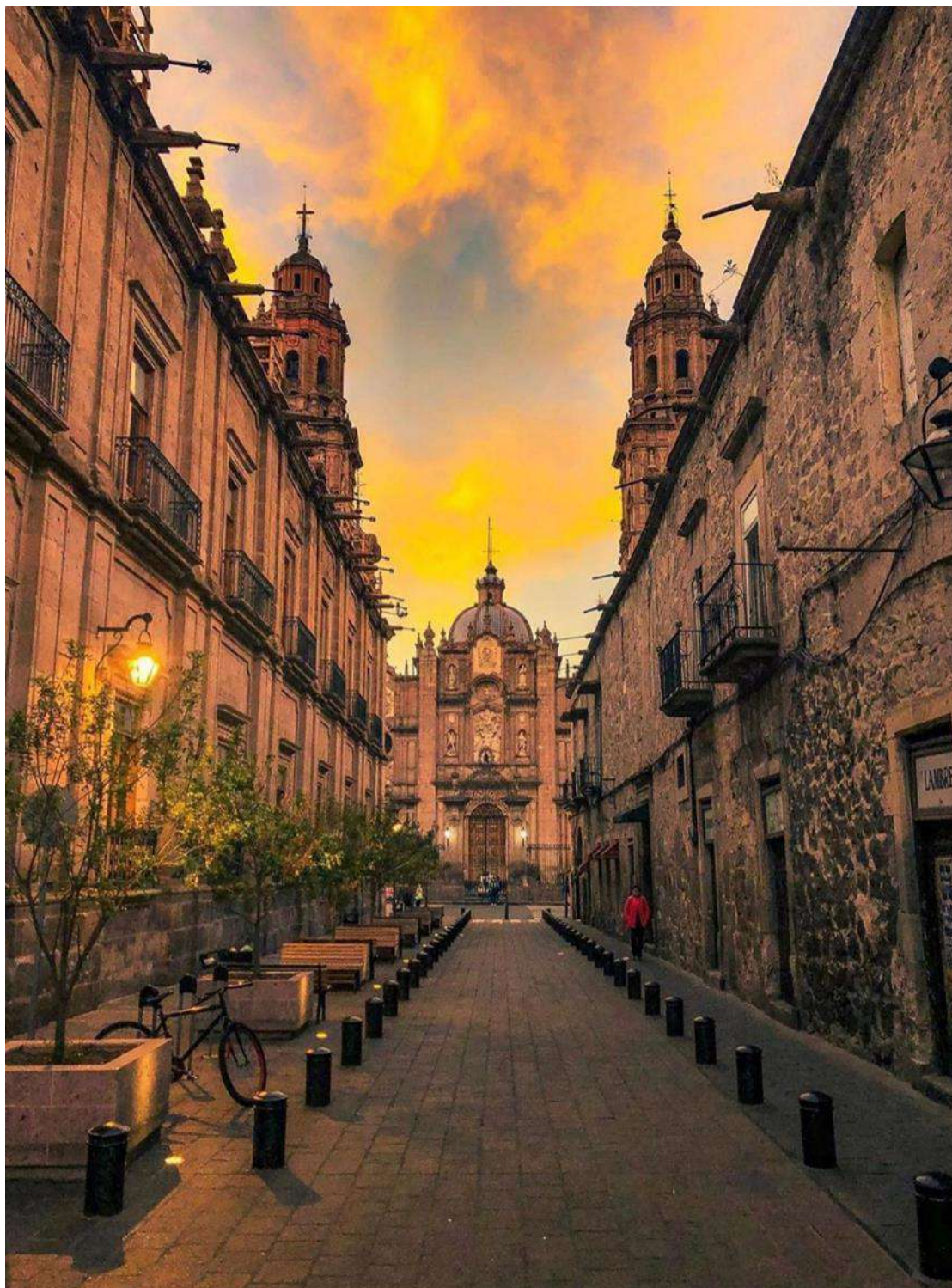
Μορέλια, η πόλη κόσμημα του βορρά!

Μία από τις πιο όμορφες επαρχιακές πόλεις του Μεξικού. Πραγματικό υπαίθριο μουσείο αρχιτεκτονικής, με υπέροχους πλακόστρωτους δρόμους, μέγαρα, εκκλησίες, καταστήματα. Θα δούμε το κυβερνητικό μέγαρο, του 1770, την πλατεία των Όπλων, το Μέγαρο Κλαβιχέρο και το υδραγωγείο του 18ου αι. Μετά την ξενάγηση θα επιστρέψουμε στην πρωτεύουσα Μέξικο Σίτυ.