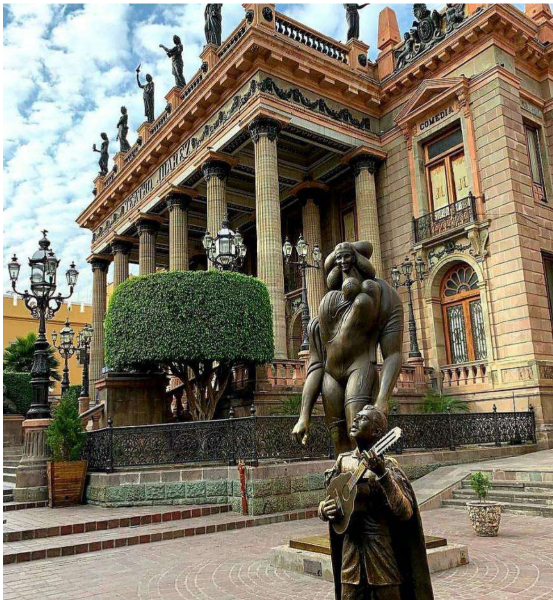
Το θέατρο Χουάρεζ

Μετά το πρωινό θα απολαύσουμε το γραφικό Γουαναχουάτο, άλλη μία πόλη που γεννήθηκε λόγω του ασημιού. Μια πόλη που ανήκει φυσικά στη λίστα της παγκόσμιας πολιτιστικής κληρονομιάς της UNESCO!!! Η ξενάγησή μας θα μας αποκαλύψει μία αμφιθεατρική πόλη με ήσυχα στενά δρομάκια, καλοδιατηρημένες πλατείες και υπέροχα αποικιακά αρχοντικά. Θα περπατήσουμε στις γραφικές αποικιακές αλέες και στις υπέροχες πλατείες, μοναδικές στη χώρα του Μεξικού. Θα δούμε το Πανεπιστήμιο, το θέατρο Χουάρεζ και θα απολαύσουμε τη θέα από το άγαλμα του Πίπιλα όπου θα ανέβουμε με τελεφερίκ.