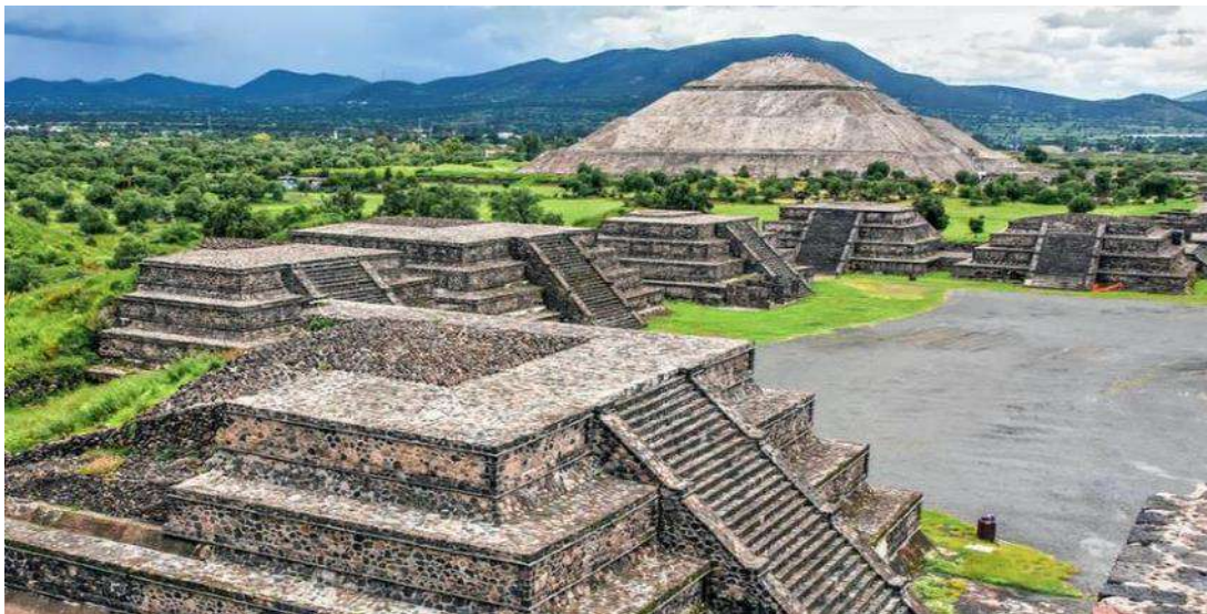
Ο αρχαιολογικός χώρος του Τεοτιχουακάν

Επόμενη στάση στον μυστηριώδη αρχαιολογικό χώρο του Τεοτιχουακάν. Βρίσκεται 40 χιλιόμετρα βορειοανατολικά της πρωτεύουσας και έως την δεκαετία του 1920 ελάχιστα πράγματα ήταν γνωστά για την περιοχή. Ανάμεσα στα 150 π.Χ. και 500 μ.Χ., ένας άγνωστος πολιτισμός της Κεντρικής Αμερικής έχτισε σε αυτό το οροπέδιο των 22 τετ. χλμ., μια εκθαμβωτική μητρόπολη, την Τεοτιχουακάν. Σήμερα, η αρχαιολογική μελέτη κατάφερε να αναπαραστήσει με απόλυτη πιστότητα την χιλιόχρονη ιστορία της αρχαίας μητρόπολης και έτσι μπορούμε να θαυμάσουμε τις επιβλητικές πυραμίδες του Ήλιου και της Σελήνης, την λεωφόρο των Νεκρών και τα κτερίσματα από οψιδιανό, που έφερε στο φως η αρχαιολογική σκαπάνη. Αργά το απόγευμα θα καταλήξουμε στο Κερέταρο όπου θα μας φιλοξενήσει απόψε.