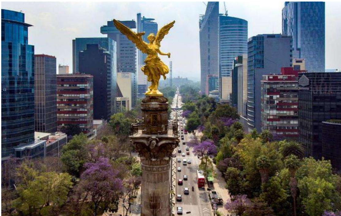
Paseo de la Reforma, Mexico City

Αναχώρηση για το Μέξικο Σίτυ, την πρωτεύουσα της χώρας και μεγαλύτερο αστικό κέντρο του κόσμου με 25 εκατομμύρια ανθρώπους! Μεγάλη, χαοτική αλλά και όμορφη, χτισμένη στα 2.250 μέτρα εκεί που κάποτε υπήρχε μια λίμνη! Εκεί που κάποτε οι Αζτέκοι είχαν μεγαλουργήσει. Εκεί που η ιστορία μπλέκεται με τον μύθο. Αυτές τις κρυμμένες ομορφιές θα ανακαλύψουμε στο μεστό πρόγραμμα που ακολουθεί.