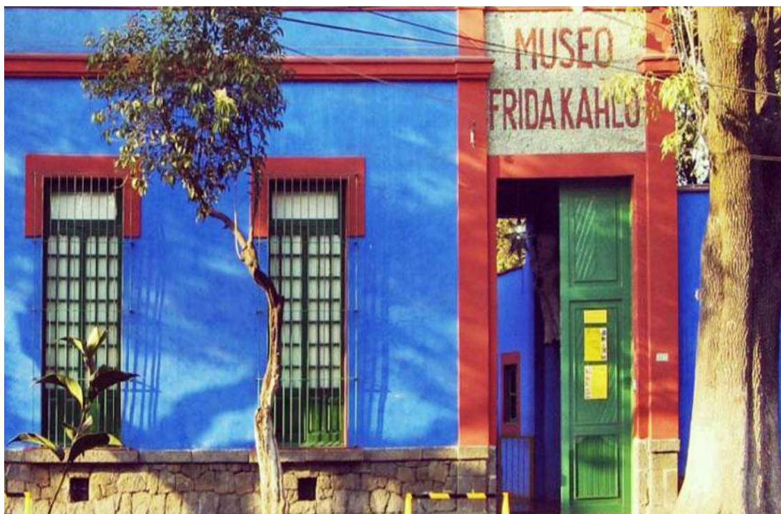
Το σπίτι της Φρίντα Κάλο

Στη συνέχεια μας περιμένει μια κρουαζιέρα στα κανάλια του Χοτσιμίλκο που βρίσκονται στην νοτιοανατολική πλευρά της πρωτεύουσας. Εξάλλου όπως έχουμε πει ολόκληρη η πόλη του Μεξικό είναι χτισμένη πάνω σε μια λίμνη! Τα κανάλια είναι ό,τι απόμεινε από την αποξήρανση της λίμνης ενώ η υποχώρηση του νερού δημιούργησε μικρά τεχνητά νησάκια που σήμερα ονομάζονται τσινάμπας! Κι επειδή οι Μεξικάνοι έχουν τη χαρά της ζωής στο αίμα τους, εδώ στο Χοτσιμίλκο, μέσα σε πολύχρωμες βάρκες τραγουδούν με τα σομπρέρος τους και τις πολύχρωμες φορεσιές τους, βάσανα κι αγάπες σε μελωδικούς σκοπούς! Με μια τέτοια «κρουαζιέρα» με συνοδεία μουσικής θα αποχαιρετήσουμε το Μεξικό. Το βράδυ γεμάτοι εικόνες θα επιβιβαστούμε στο αεροπλάνο όπου μέσω ενδιάμεσου σταθμού θα επιστρέψουμε στην Ελλάδα.