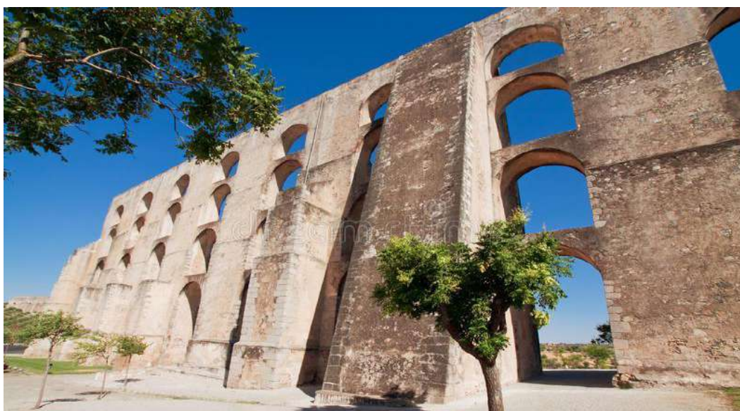
Το υδραγωγείο του Κερέταρο

Το Μεξικό είναι γεμάτο πολιτιστικούς θησαυρούς κι ένας από αυτούς είναι και η πόλη του Κερέταρο, μνημείο πολιτιστική κληρονομιάς της UNESCO!!! Φυσικά θα την επισκεφθούμε, θα δούμε το θαυμάσιο υδραγωγείο της, το θέατρο και το ιστορικό της κέντρο με την Plaza de la Corregidora.