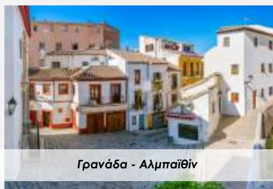
Γρανάδα - Αλμπαιϊθίν