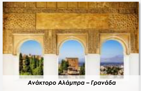
Ανάκτορο Αλάμπρα – Γρανάδα