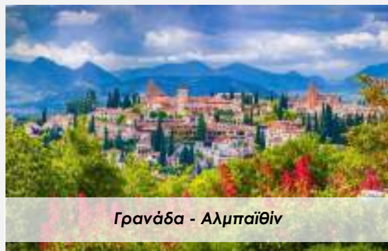
Γρανάδα - Αλμπαιϊθίν

Μία ακόμη πρόταση, είναι να επισκεφθούμε τη συνοικία των Ρομά με την ονομασία Σακρομόντε. Η συνοικία αυτή είναι η πιο γραφική της Γρανάδας. Είναι χτισμένη