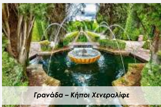
Γρανάδα - Κήποι Χενεραλίφε