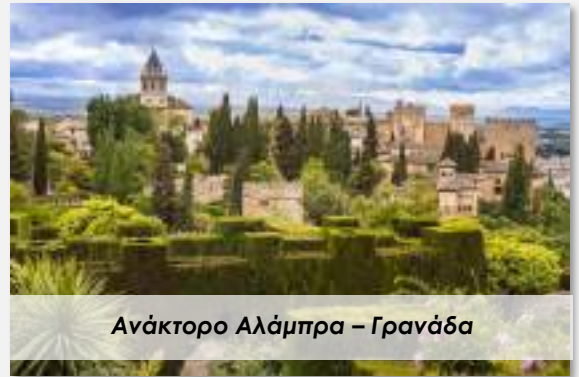
Ανάκτορο Αλάμπρα – Γρανάδα

Όταν το εμιράτο της Γρανάδας επανενώθηκε με τη βασιλεία της Ισπανίας, τον 15ο αιώνα οι Καθολικοί βασιλείς Φερδινάνδος (της Αραγονίας) και Ισαβέλλα (της Καστίλης) μετακόμισαν στην Αλάμπρα και άλλαξαν χρήση σε πολλά από τα κτίρια. Σε μία από τις αίθουσες του παλατιού, το 1492, ο Χριστόφορος Κολόμβος έλαβε την εντολή από το βασιλικό ζεύγος να ξεκινήσει για το εξερευνητικό ταξίδι του που οδήγησε στην ανακάλυψη της Αμερικής. Άρα η Αλάμπρα, πέρα από αρχιτεκτονικό αριστούργημα είναι και τοπόσημο που συμβολίζει την αλλαγή ολόκληρου του κόσμου. Σήμερα στεγάζει επίσης το ομώνυμο μουσείο, στο οποίο εκτίθενται αντικείμενα και κειμήλια του παλατιού, καθώς και το Μουσείο Τέχνης της Γρανάδας. Ο Φερδινάνδος και η Ισαβέλλα είναι θαμμένοι στο παρεκκλήσι του Καθεδρικού Ναού.