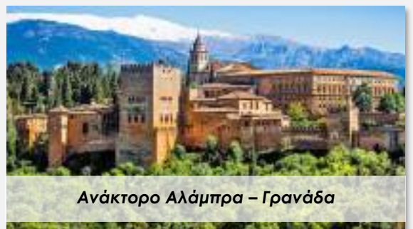
Ανάκτορο Αλάμπρα – Γρανάδα