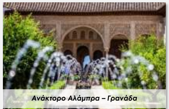
Ανάκτορο Αλάμπρα – Γρανάδα