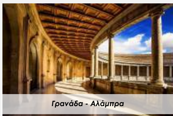
Γρανάδα - Αλάμπρα