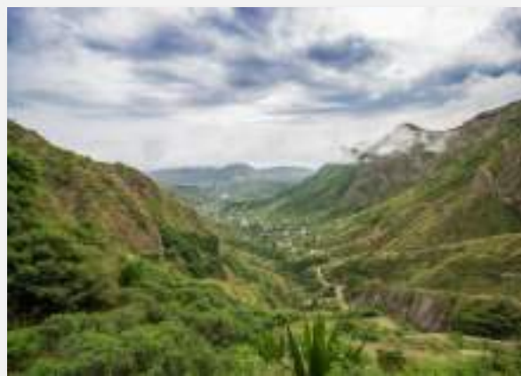
Καταπράσινο τοπίο στο Σάντο Αντάο