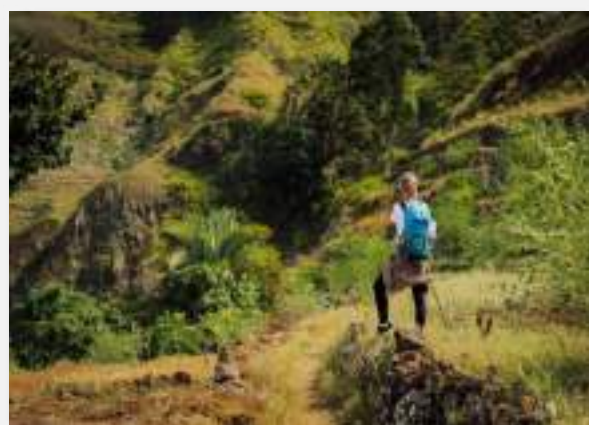
Οι φίλοι της φωτογραφίας θα λατρέψουν το Σάντο Αντάο