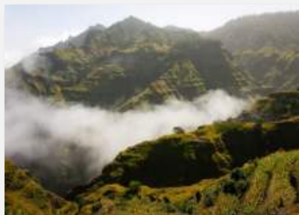
Ορεινό πράσινο τοπίο στο Σάντο Αντάο