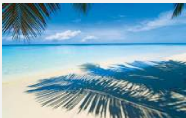
Χαρακτηριστική λευκή παραλία στο Πράσινο Ακρωτήριο