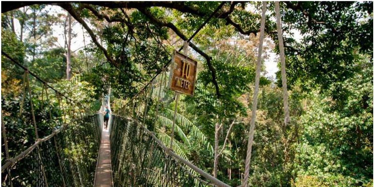
Διανυκτερεύσεις: Κουάλα Λουμπούρ (3), Ταμάν Νεγκάρα Δάσος της βροχής (2)