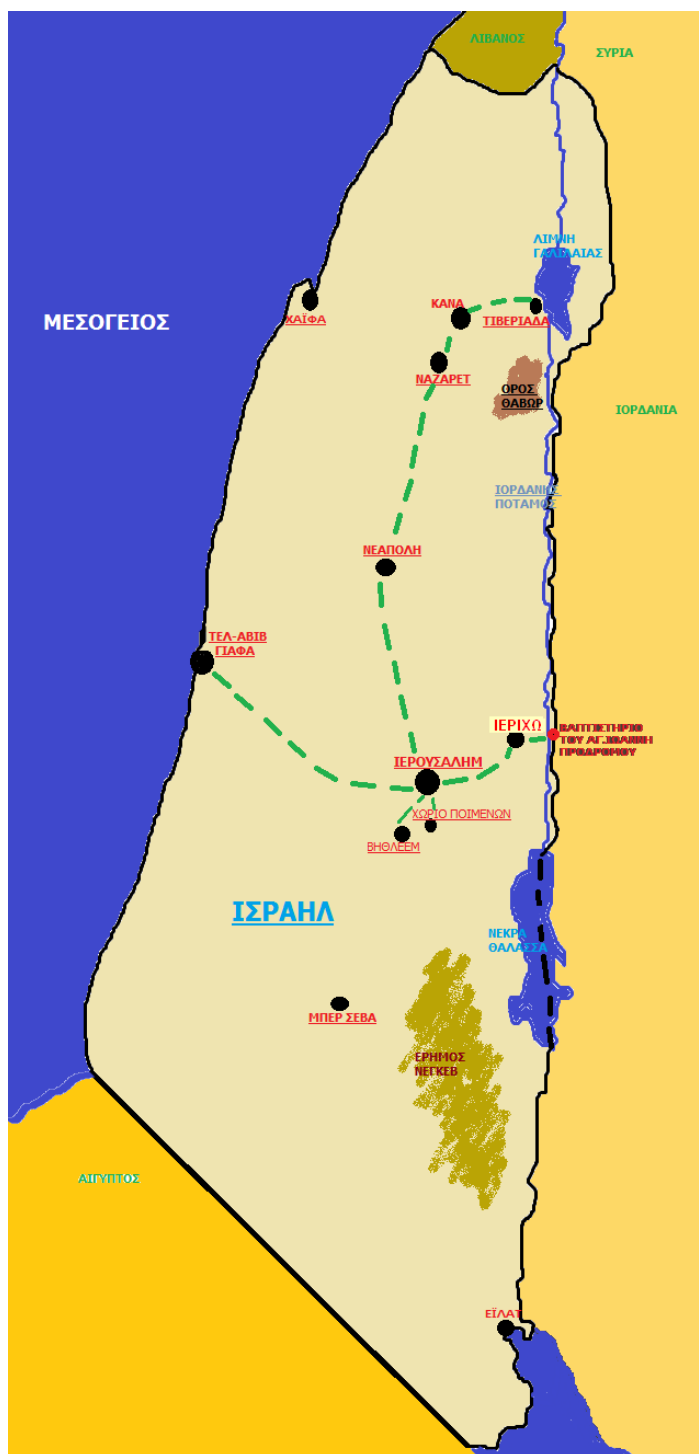
ΟΔΙΚΟΣ ΧΑΡΤΗΣ ΑΓ. ΤΟΠΩΝ